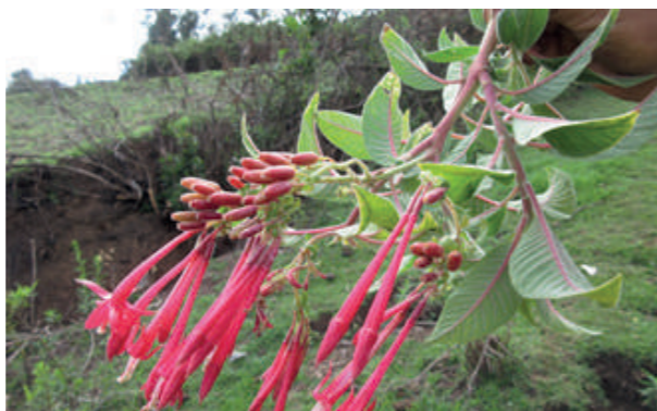
Flor de Chumpi chumpi ( Viburnum hallii )

El conocimiento tradicional es la manera de explicar o interpretar la realidad que tiene un grupo de personas (UNESCO, 2012). También se define como la realidad social, cultural, política o ambiental, que incluye valores e interpretaciones, elaborado con base en la observación de los fenómenos de dicha realidad. Los conocimientos tradicionales e indígenas constituyen una base de información indispensable para numerosas sociedades que procuran vivir en armonía con la naturaleza (Ban Ki-Moon, 2015).