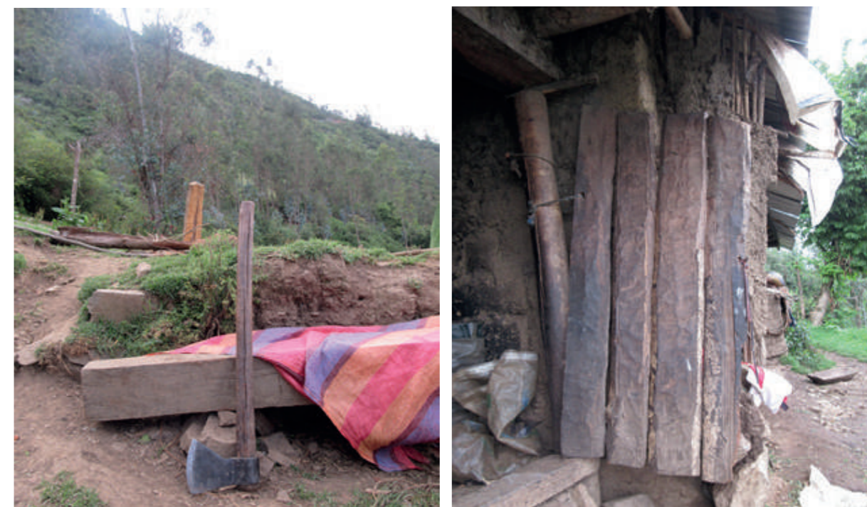
Mango de hacha de madera del árbol "Chachacoma" ( Escallonia resinosa ) y puerta de madera del árbol "Palta patay" ( Nectandra sp )