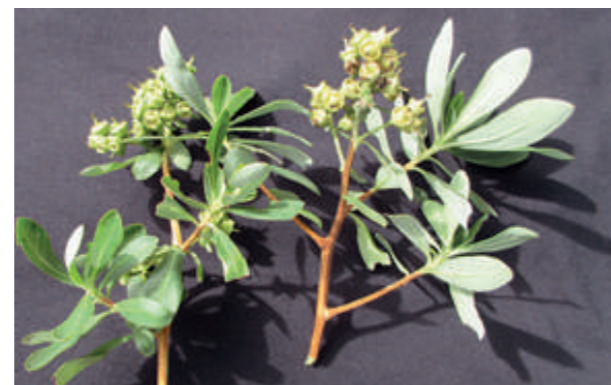
Flor de "Chachacomo" ( Escallonia resinosa )

La mancomunidad dispone de bosques alto andinos, en su mayoría clasificados como Bosque Altimontano Pluviestacional de Yungas, no dominados por Polylepis sp., propios de las zonas con bioclima pluviestacional húmedo de las Yungas. Se trata de un bosque de altura media, denso siempreverde estacional con dosel de 10-20 m (CDC –UNALM 2017).